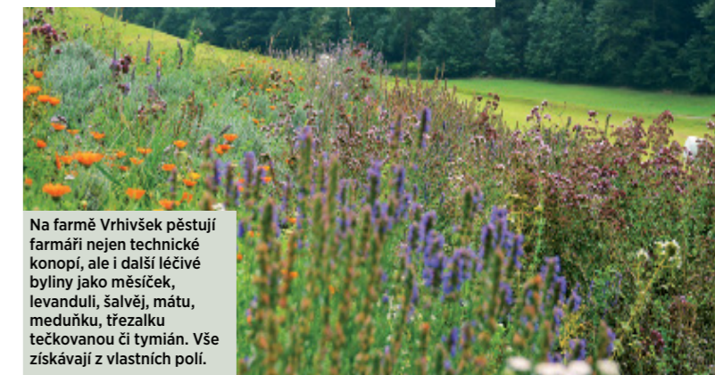
Na farmě Vrhivšek pěstují farmáři nejen technické konopí, ale i další léčivé byliny jako měsíček, levanduli, šalvěj, mátu, meduňku, třezalku tečkovanou či tymián. Vše získávají z vlastních polí.

získal svým etickým přístupem a mimořádnou kvalitou přípravků," říká Beata a dodává, že například terapeutický balzám s účinnou látkou CBD (cannabidiol) je na jejím e-shopu bestsellerem. "Těší mě hlavně zpětné vazby od zákazníků, kteří se po mnoha letech zbavili úporných ekzémů, seborhoické dermatitidy, nebo se jim vyléčilo akné. Každá taková reakce dává mé práci obrovský smysl," dodává majitelka e-shopu, se kterou jsme se do zeleného srdce Evropy vydaly ještě za doprovodu fotografky Michaely E. Szabó, která celou naši cestu zdokumentovala.