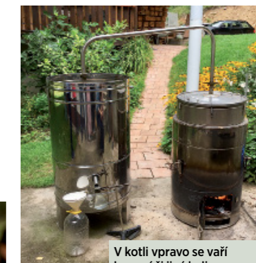
V kotli vpravo se vaří konopí či jiné byliny, vlevo je destilátor, z něhož vytéká hydrolát a esenciální (éterický) olej.

získal svým etickým přístupem a mimořádnou kvalitou přípravků," říká Beata a dodává, že například terapeutický balzám s účinnou látkou CBD (cannabidiol) je na jejím e-shopu bestsellerem. "Těší mě hlavně zpětné vazby od zákazníků, kteří se po mnoha letech zbavili úporných ekzémů, seborhoické dermatitidy, nebo se jim vyléčilo akné. Každá taková reakce dává mé práci obrovský smysl," dodává majitelka e-shopu, se kterou jsme se do zeleného srdce Evropy vydaly ještě za doprovodu fotografky Michaely E. Szabó, která celou naši cestu zdokumentovala.