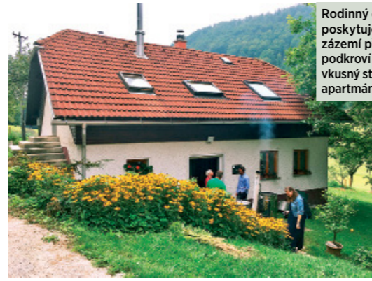
Rodinný domek poskytuje farmářům zázemí při výrobě. V podkrovní vybudovali vkusný stylový apartmán pro hosty.