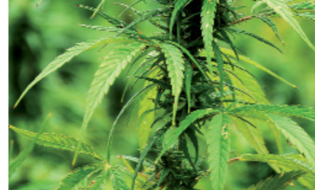
Pro japonský trh destilují farmáři pouze konopné stonky bez obsahu CBD, protože v Japonsku není jeho použití zatím stále ještě povoleno. Nejvyšší koncentraci CBD má konopí v květech.