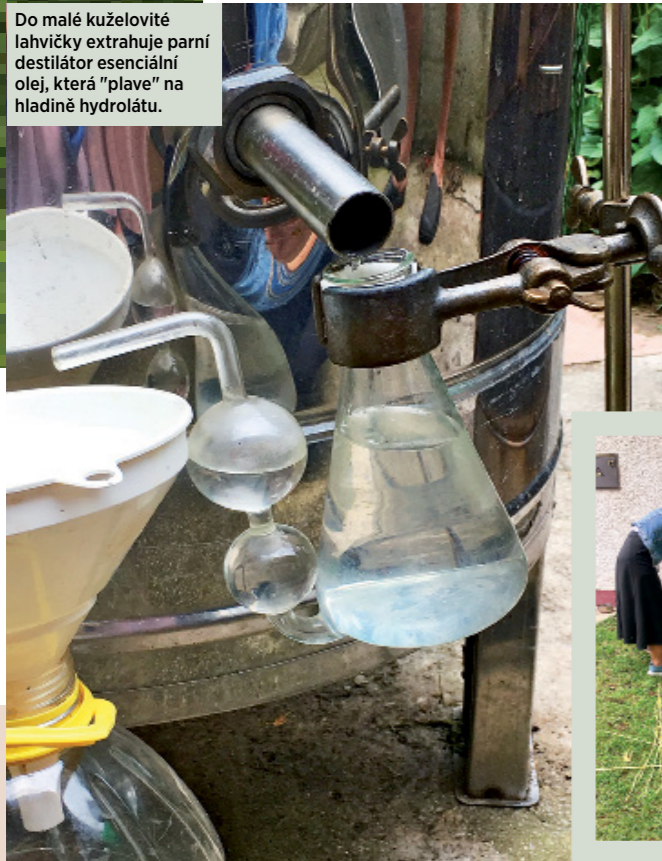
Do malé kuželovité lahvičky extrahuje parní destilátor esenciální olej, která "plave" na hladině hydrolátu.