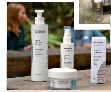
Značka Hemptouch využívá z konopí do svých produktů hydrolát, CBD (cannabidiol) a rostlinný a esenciální olej.